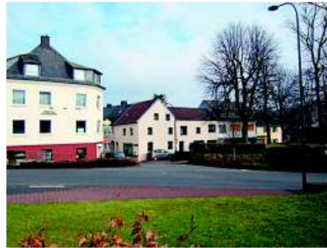
Das obere Ende der Hillstraße – ganz links stand früher der Ziehbrunnen.

stand früher ein Ziehbrunnen, aus dem die Bewohner des Stadtteils sich mit Eimern ihr Trink- und Waschwasser holten, bevor die städtische Wasserleitung dieses direkt ins Haus lieferte.