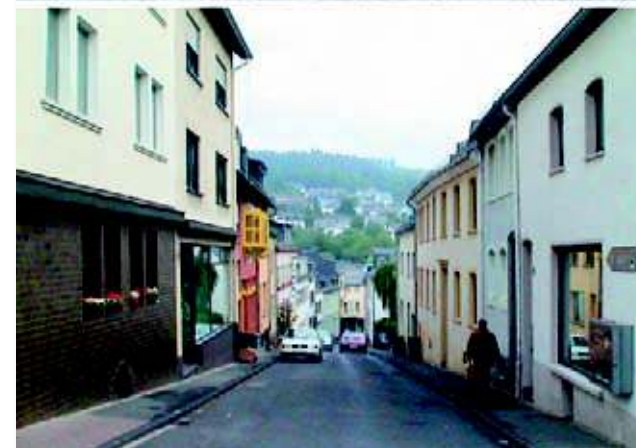
Die ursprünglichen Häuser der rechten Straßenseite haben den Krieg überstanden