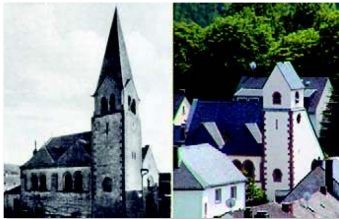
Die evangelische Kirche – das Wahrzeichen der Hillstraße