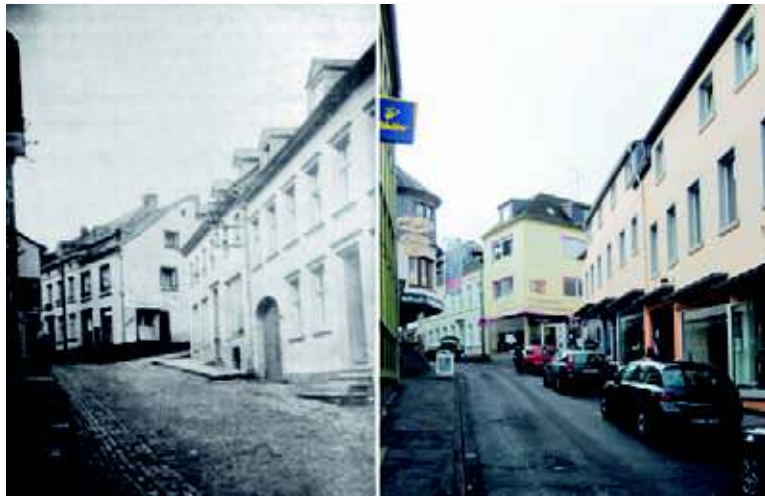
So autofrei wie vor 90 Jahren ist die Hillstraße heute nicht mehr