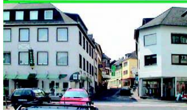
Vom Johannismarkt geht es bergan durch die enge Hillstraße

Buchhandlung Behme. Die am Ende dieser Häuserzeile in die Straße hineinragende Giebelfront gehört zum Schuhhaus Blum-Tacky, heute Schuh- und Sport Gottlieb.