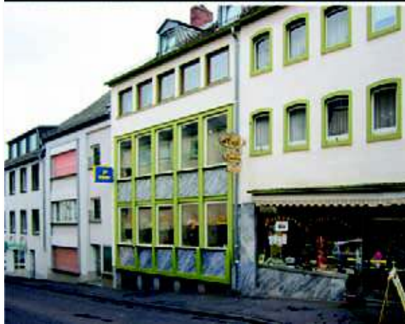
Interessant ist der Vergleich früher – heute in der unteren Hillstraße