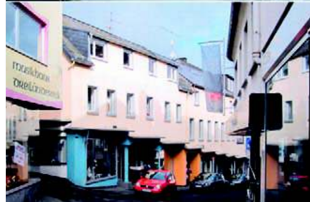
Hier zweigt die Enggasse ab

Ende des neunzehnten Jahrhunderts etliche Handwerksbetriebe und Geschäfte niedergelassen hatten, herrschte besonders tagsüber ein reges Leben auf der Straße.