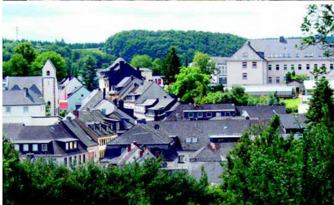
Die Hillstraße ist heute wie früher eng bebaut