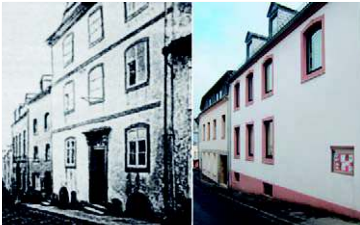
An der Stelle des früheren ev. Pfarrhauses steht heute das ev. Gemeindehaus