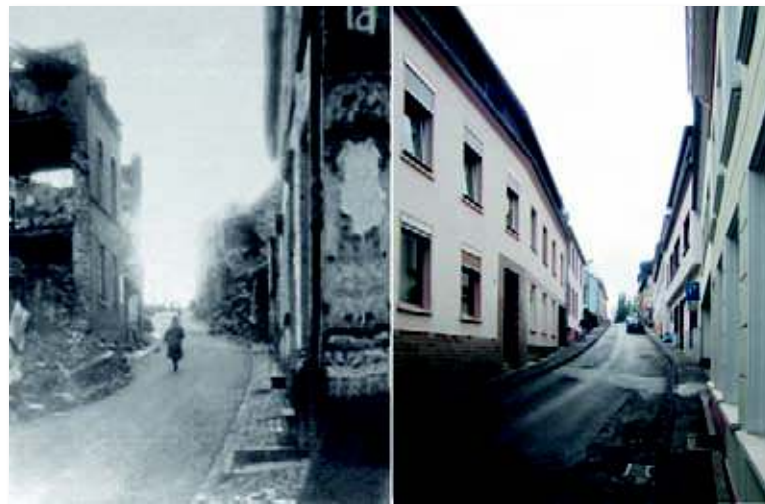
Die Hillstraße blieb nicht von Kriegszerstörungen verschont

Von alters her wurden Wege, die an beiden Seiten in das umgebende Gelände eingeschnitten waren, im Volksmund „Holl“, „Hüll“ oder „Hill“ benannt. Die Hillstraße ist auch ein solcher Hohlweg. Bei der steilen Abzweigung der Engasse und dem Treppenaufstieg zur evangelischen Kirche ist dies noch gut zu erkennen.